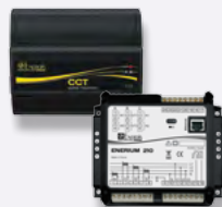
Concentrateurs collecteurs de données