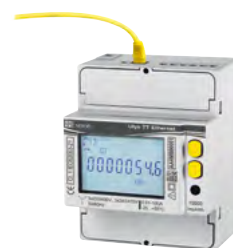
ULYS TT Ethernet