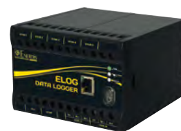
ELOG DATA LOGGER

Les concentrateurs et collecteurs CCT et ENERIUM 210 mémorisent en continu les informations issues de compteurs (sortie impulsion) ou de capteurs de température, de débit (signaux 0-20 mA / 4-20 mA). Equipés en standard d'une sortie RS485 ModBus ou Ethernet ModBus TCP, ils sont télé-relevables à distance.