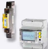
Compteurs divisionnaires et tarifaires