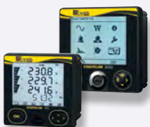
Centrales de mesure