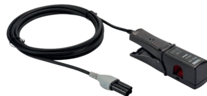
ZANGENSTROMWANDLER MINI 94

Der Zangenstromwandler Mini94 ermöglicht die Messung von Wechselstrom von 50 mA bis 200 A ohne Eingriff in die Anlagen (keine Unterbrechung des Messstroms). Aufgrund seiner hervorragenden Genauigkeit (Verstärkung und Phase/Genauigkeitsklasse 0,2) eignet er sich besonders für Strommessungen mit Leistungs- und Energieanalysatoren. Er kann unter anderem zur Überprüfung von Energiezählern herangezogen werden.