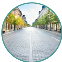
En voirie public