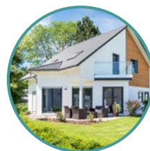
Wallbox en résidentiel (pour particulier)