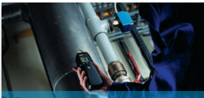
Messung physikalischer Größen