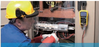
Messung bei Niederspannung