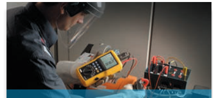
Messung, Erfassung und Analyse elektrischer Leistung & Energie