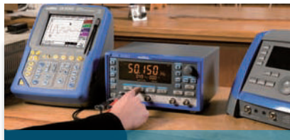
Messgeräte für die Elektronik