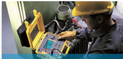
Messung & Prüfung der elektrischen Sicherheit